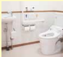
広々快適な シャワー付トイレ