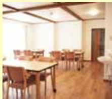
陽当たりの良い 食堂・娯楽スペース