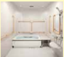
充実の介護用 システムバス