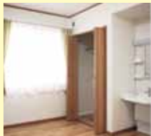
車イス対応洗面化粧台と クローゼット完備の居室